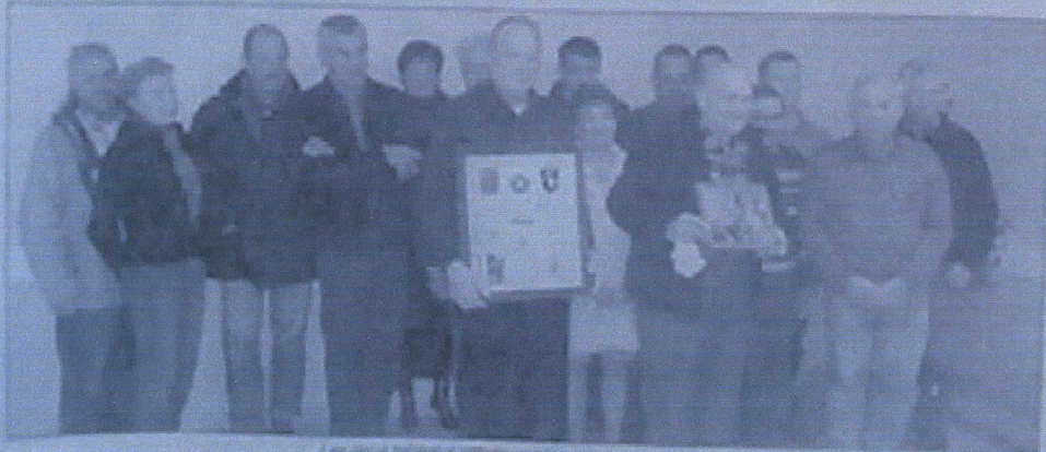
Les deux tableaux offerts au maire et à la commune

le dernier jour de la guerre de nos camarades ont vu... Dans le nuit du 6 juin, il est 2 à 32 heures d'attente à l'aéroport... Le 6 juin est la fête de la commune de La Bonneville, le 11 juin par la commune de La Bonneville.